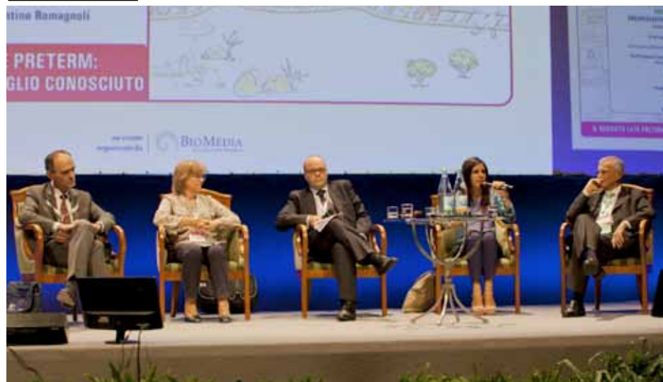
La sessione inaugurale del Congresso 2014

darci delle novità incoraggianti. Ma parleremo anche del futuro visivo dei nostri pretermine oltre i problemi connessi con la ROP.