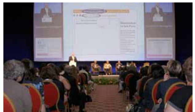
Una sessione del Congresso Nazionale 2014

Early Human Development, ma oltre a problemi di tipo economico abbiamo avuto problemi relazionali che ci hanno indotto a cambiare. Sulla scia di quanto realizzato dalla SIP abbiamo stretto un accordo con Biomed Central per la pubblicazione dei soli abstract. La presentazione dei singoli contributi dei soci è stata realizzata poi in forma elettronica con buona partecipazione e soddisfazione sia dei soci che hanno contribuito con i propri lavori sia di quelli che li hanno consultati e graditi.